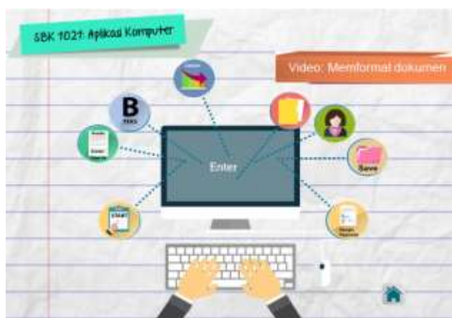
Rajah 3: Antaramuka kandungan Video subtopik pemrosesan perkataan.