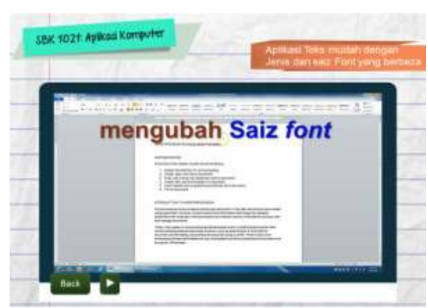
Rajah 4: Antaramuka kandungan Video di dalam aplikasi eComDeaf.