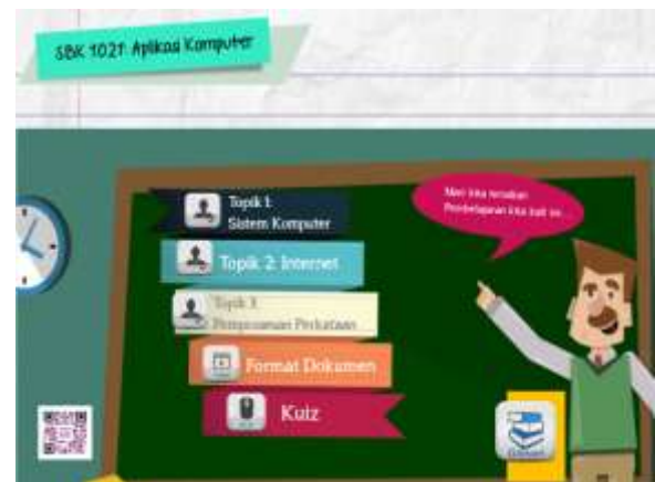
Rajah 2: Antaramuka Menu Aplikasi eComDeaf yang merangkumi topik bagi subjek SBK1021: Aplikasi Komputer.