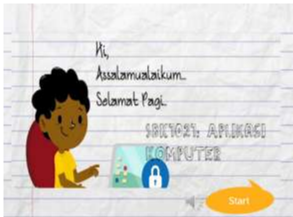
Rajah 1: Antaramuka Menu Utama Aplikasi eComDeaf yang memaparkan elemen animasi dan audio.