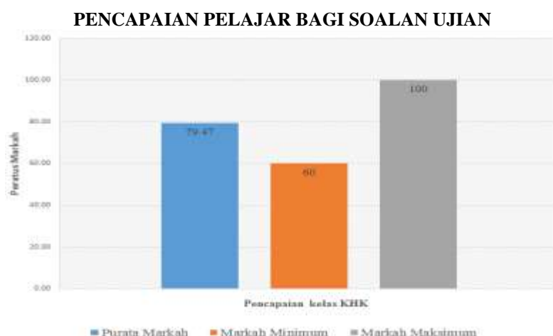
Rajah 7: Taburan markah soalan Ujian bagi Pelajar KHK

Impak eComDeaf ini dilihat menerusi skor markah pelajar bagi soalan Ujian. Dapatan kajian menunjukkan kesemua pelajar iaitu 19 orang pelajar lulus. Purata markah pencapaian pelajar ialah 79.47%.