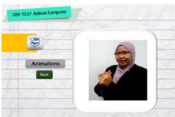
Rajah 5: Antaramuka glosari aplikasi eComDeaf.