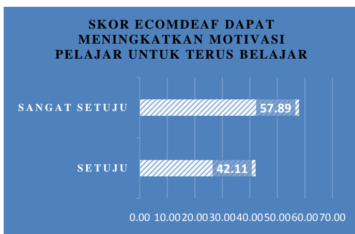
Rajah 10: Skor menunjukkan 57.89% pelajar sangat bersetuju bahawa eComDeaf dapat meningkatkan motivasi pelajar untuk terus belajar.