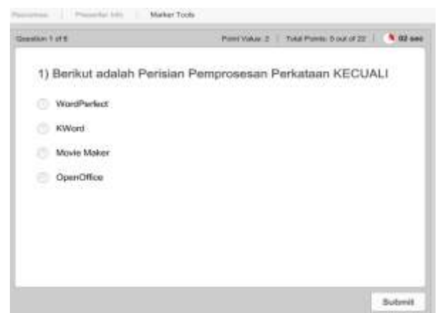
Rajah 6: Antaramuka latihan pengukuhan aplikasi eComDeaf.